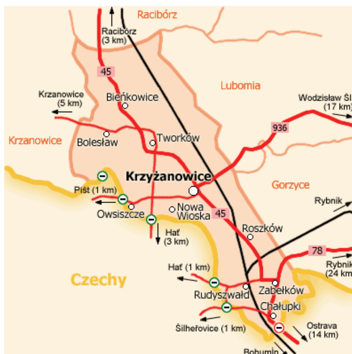
Rysunek - Układ sieci dróg i linii kolejowych na terenie Gminy Krzyżanowice

Szczegółowe zestawienie dróg powiatowych i gminnych, a także linii kolejowych przedstawiono na mapce poglądowej.